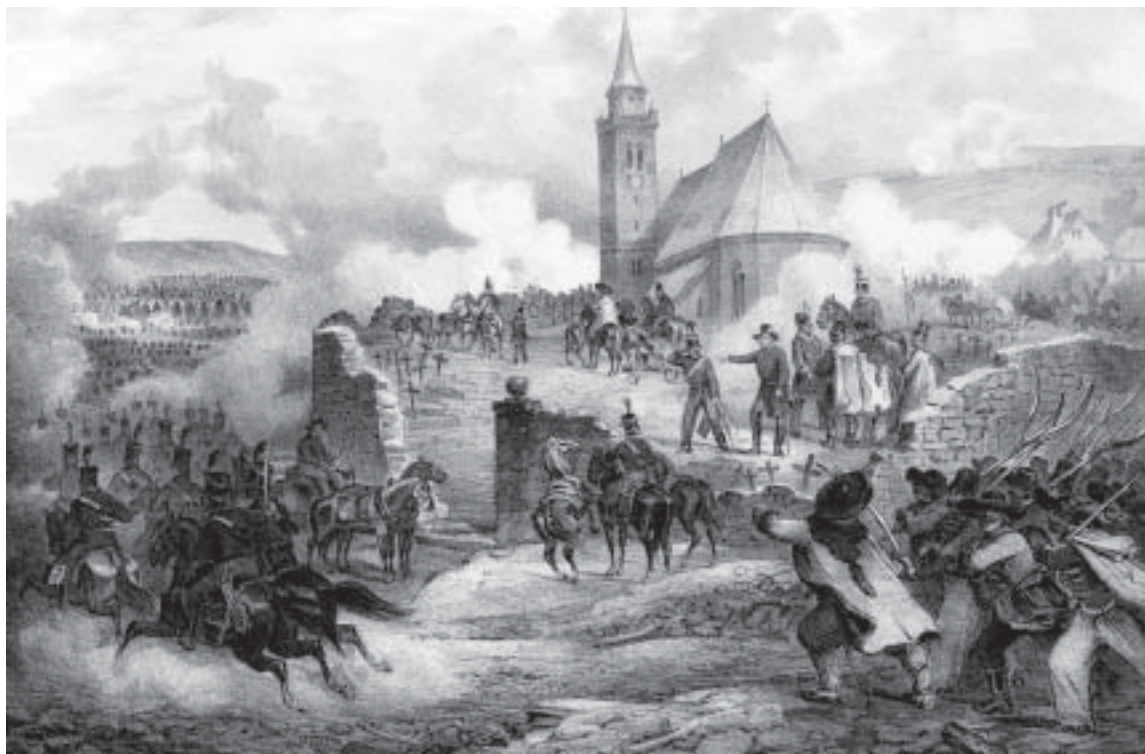
A szászsebesi ütközet (Armee-Bulletin)