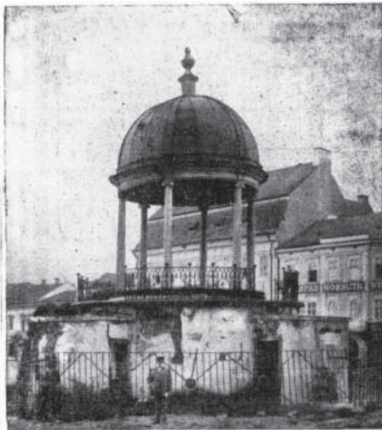
A marosvásárhelyi Bodor-kút (Szentgyörgyi 1912)