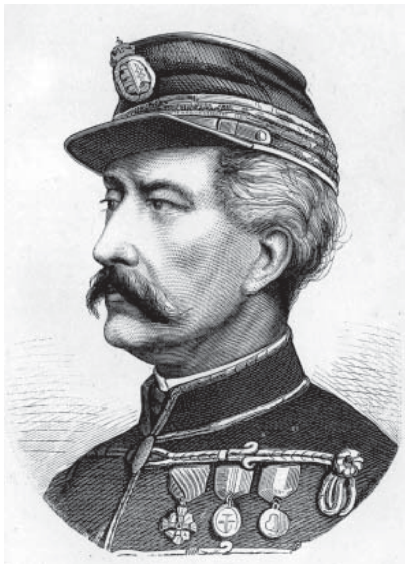
Gróf Bethlen Gergely (Czetz 1868)