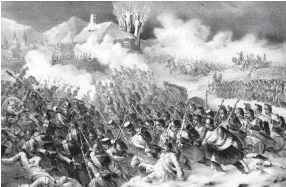
A nagyszebeni ütközet (Armee-Bulletin)