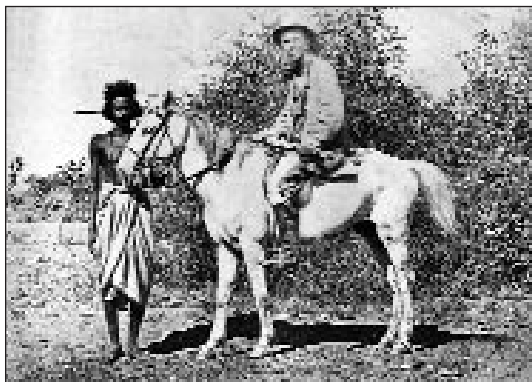
Gr. Esterházy Mihály Afrikában néger kísérijével (1881)

ábrázolón, a mellette levő teremben néhány csatakép a török időkből, az udvarra néző széles folyosón a családanyák képei, mindegyiken feljegyezve, hogy hány gyermeket nevelt fel, a nagykapu melletti teremben Esterházy Mihály főleg afrikai vadásztrófeái: néger pajzsok, bumerángok, agancsok, annak az oroszlánnak a bőre, amelyik megsebesülve Mihály gróf hátából mancsával jókora darabot kiszakított (a gróf életét néger kísérije mentette meg, aki késével a vadállatot leszúrta). Akadt ott a régi hadi felszerelésekből is. Többi között gyöngyházzal kirakott kovápuska. Ott szerénykedett egy somfa nyelű gerezdes buzogány, melynek behorpadt gerezdjei harcos múltról árulkodtak.