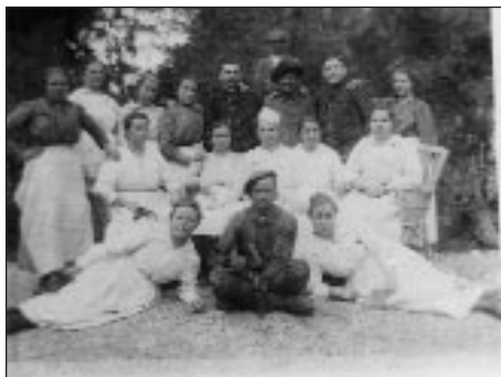
A kastély személyzete (1919)

sokszorozva láthatta magát. Az emeletet középtájon egy félkörívben elhelyezett beépített szekrény sor választotta ketté; az egyforma szekrényajtók közül az