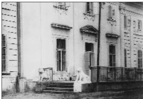
A kastély terasza az ötvenes évek végén

tudtak, azt összezúzták. Erre a sorsra jutott a tükörszoba is. A főépület előtti mitológiai homokkőszobroknak szintén nyomuk veszett. Az egykor Cseklésről áthozott levéltár sok értékes darabját a tallósi és a vezekényi árkokban hordozta a szél.