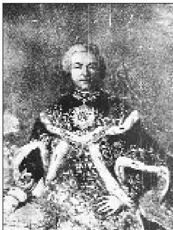
Gróf Esterházy Ferenc főkancellár

rezidenciája, lakóhelye van, amiben egyházasági engedéllyel felállított kápolna van... “ Nevezett Esterházy Mik-lós Esterházy Ferenc (1711-1764) tárnokmester és gróf Pálffy Szidónia fia a fraknói ágból; testvérbátyja, Ferenc főkancellár a cseleksi ág megalapítója.