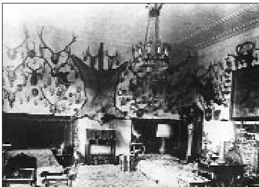
A kastély vadászszobája

jól Tallóson. A cseklészi kastély után az itteni csak kunyhónak tűnt neki, s ha szerét ejthette, másutt tartózkodott.