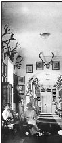
A kastély folyosó

Esterházy Mihályné az özveggyi jog fenntartásával tehát igyekezett a lehető legkényelmesebben berendezkedni, azonban mégsem érezte magát