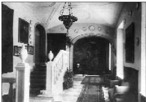
Márványfeljárt az emeletre

tengerészeti akadémiát végzett tisztet, akit az olasz háború kitörésével 1916-ban előbb Ausztriában, majd 1918-ban a tallósi