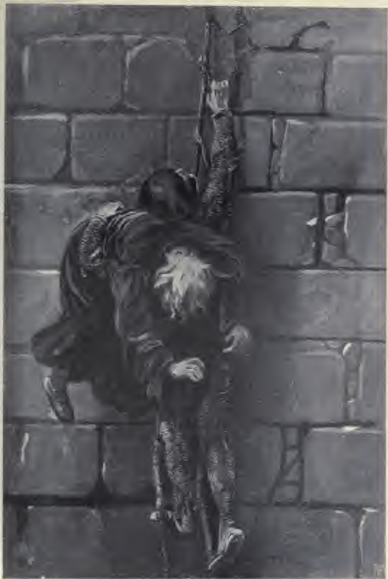
Vállán emelle le atyját.