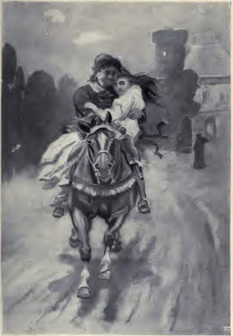
A király rövidre vonta a kantárt.