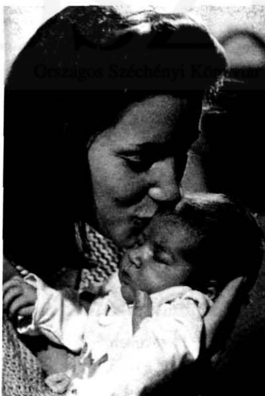
6. Az első anyai puszik egyike.