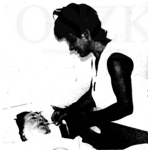
14. Az utolsó korty is enyhít a haldokló betegen, ha a nővér szeretettel és odaadással nyújtja.