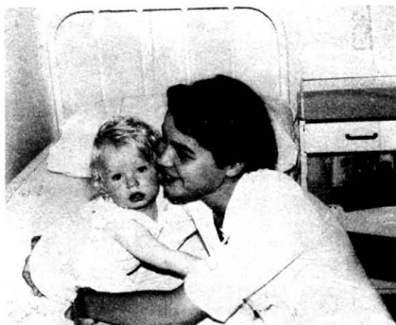
13. A beteg gyermek anyaként fogadja el a szeretetet sugárzó nővért és odabúvik hozzá