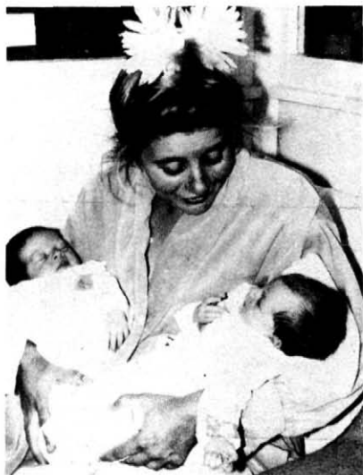
5. Édesanyjuk szerető gügyögése a jóllakott ikrekhez.