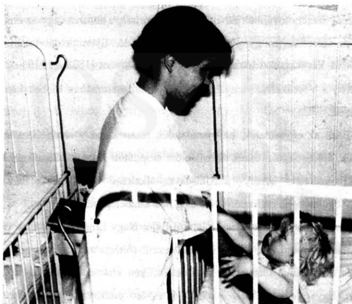
12. A beteg gyermekben nincs félelem a szerető mosollyal közeledő nővér iránt , és megkapaszkodik annak feléje nyújtó kezében.

Lehajtottam a fejemet. És csak későn jutott eszembe: hány női kéz fölé hajoltam életemben, de az még soha nem fordult meg elmémben, hogy megcsókoljam a legelesettebbek fölé is a remény ejtőernyőjét varázsló nővér fáradt kezét." 100