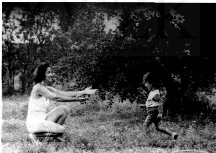
9. Az anyai mosoly, az ölelésre kitért, hívó kar az anya felé futásra ösztönzi a 2 éves gyermeket.