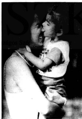
11. A szeretet egyik erőteljes, spontán kifejezése: a gyermek anyja orrába harapva a szájával is "kapaszzkodik".