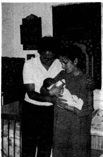
8. A szülők szeretetében melegedő újszülött.