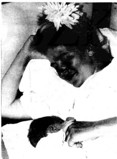
4. A szeretettel végzett szoptatás közben a gyermek anyja kezébe kapaszkodik.