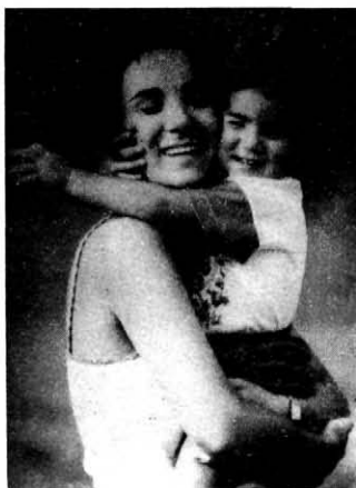
10. A találkozás öröme: kölcsönös átkarolás, ölekezés és az arc szeretetteljes összeszorítása