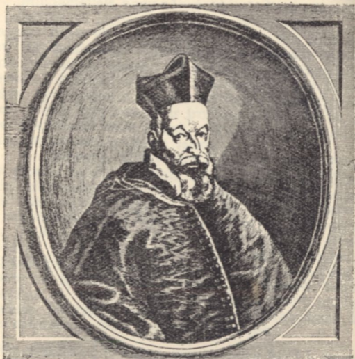
PETRUS. I. PAZMANY S. R. E. CARDI. ARCHIEPISCOPUS. STRIGONI. Obijt Paronũ XIX Martij Anno MDCXXXVII