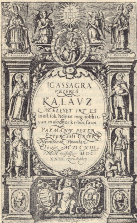
A Kalauz második kiadásának czimlapja.