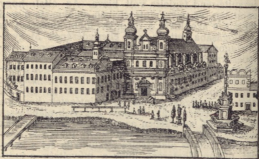
A nagyszombati egyetem.

Nem mind a négy kart, csak a hittudományit és bölcséletit óhajtotta egyelőre felállítani. Szervezetére nézve az egyetem teljesen a nagyszombati kollegiumhoz simúlt. A jezsuita rend vette az egyetemet is kezébe, a rend tagjai, illetve a kollegium tanári testülete alkották az egyetemnek tanári karát is, nemkülönben tanterve is teljesen a rend tanterve alapján mozgott. Intézkedéseihöz sikerült a királytól a megerősítést is kinyerni, melyet Ferdinánd