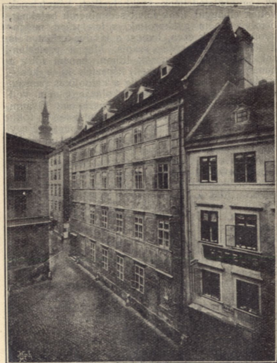
A Pázmáneum Bécsben,