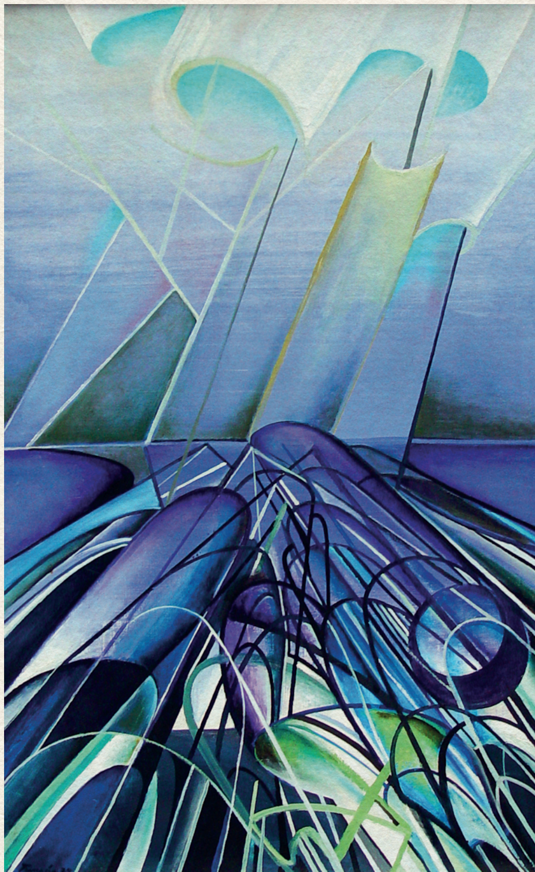
ÉMLÉK A JÖVŐBŐL – 1973., farost, olaj, 100x73 cm