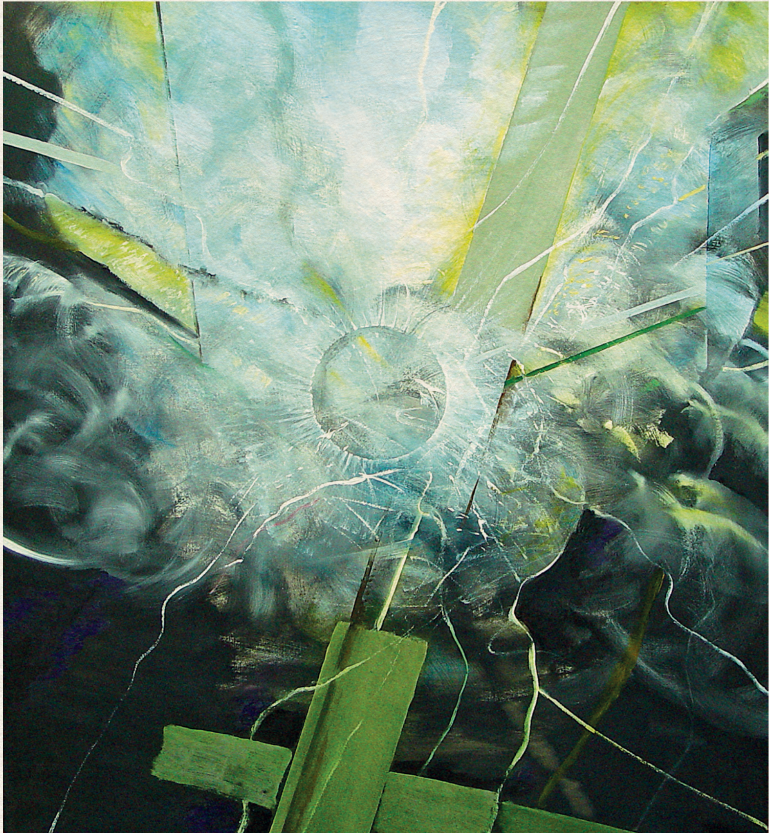
XV. STÁCIÓ – 2000., farost, olaj, 110x100 cm