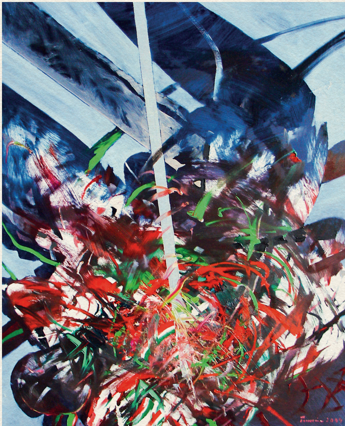
GOLGOTA I. – 2004., farost, olaj, 122x100 cm