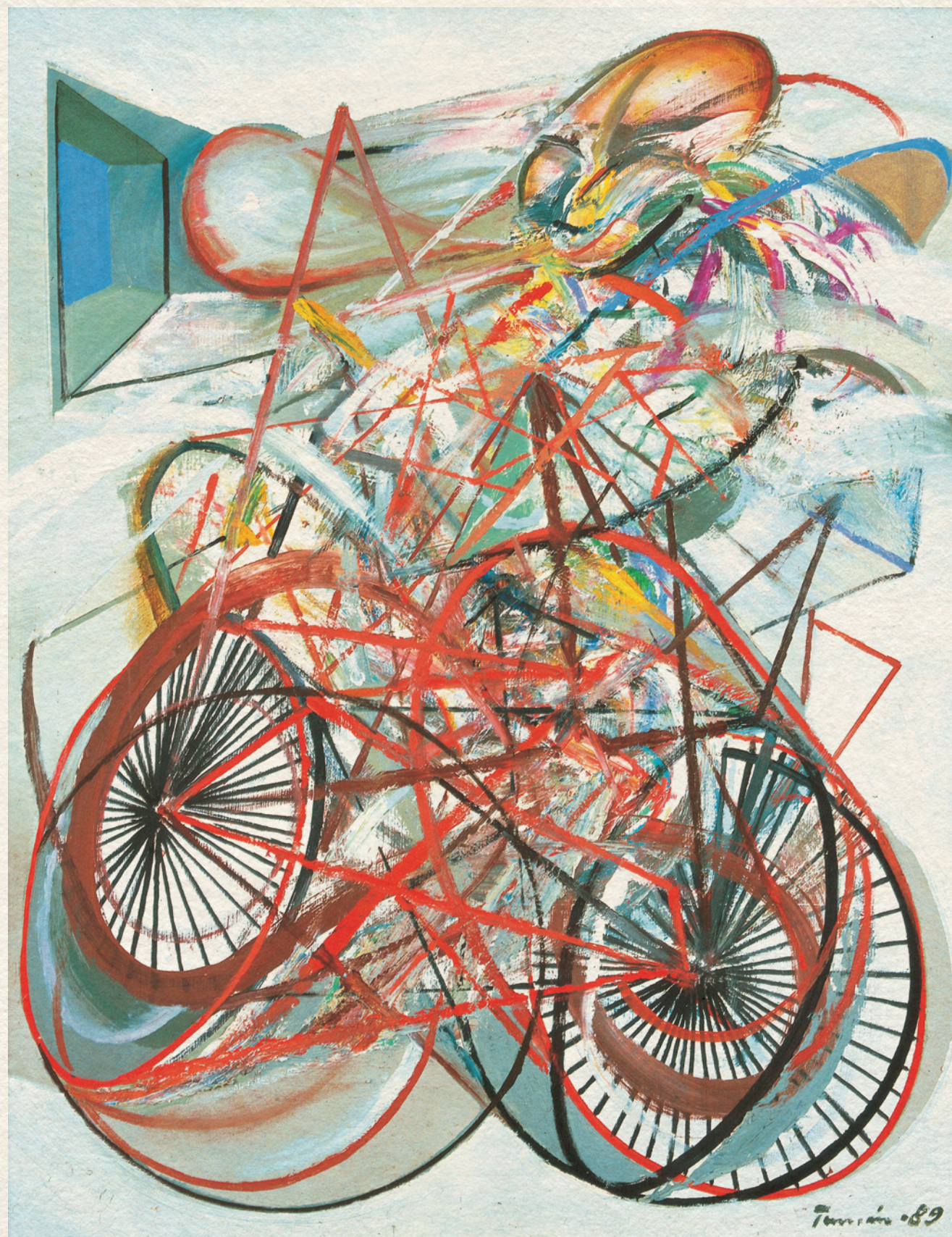
HOMMAGE À SAMUEL BECKETT – 1989., farost, olaj, 75x59,5 cm