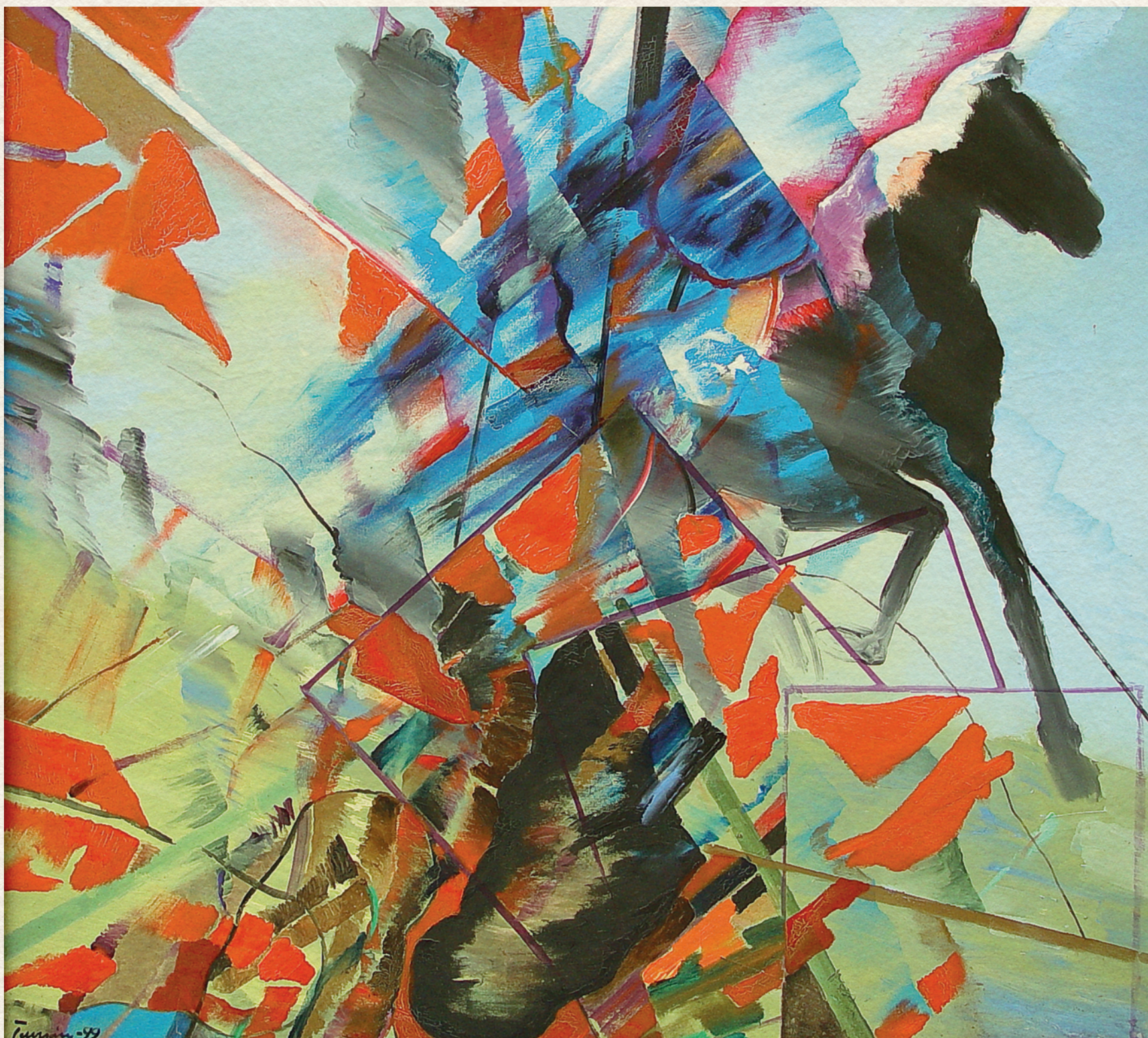
VESZTETT CSATA – 1999., farost, olaj, 100x110 cm