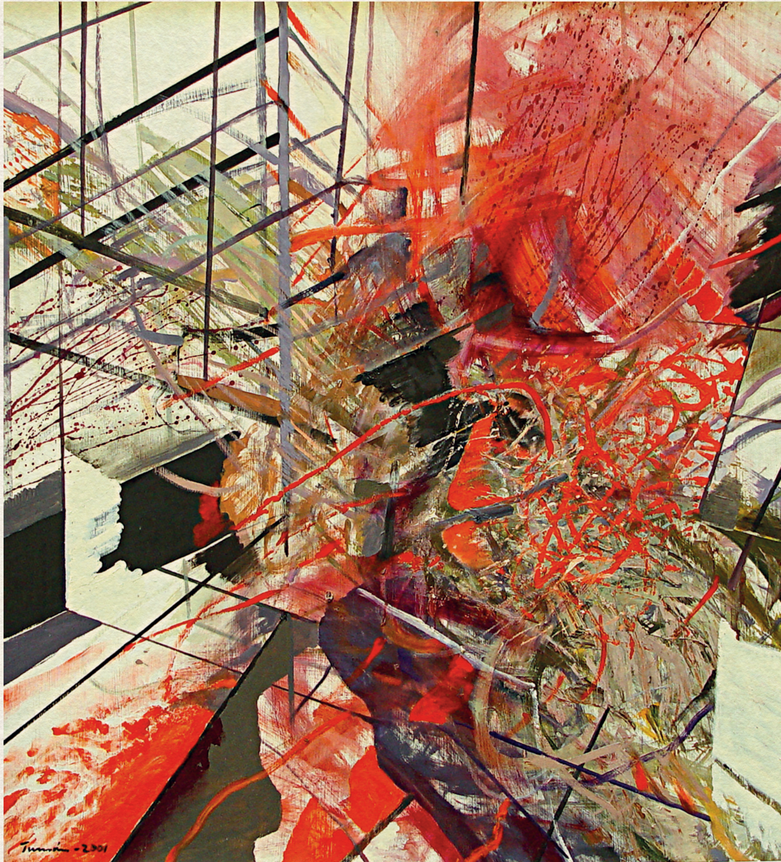
TETTHELY – 2001., farost, olaj, 105x96,5 cm