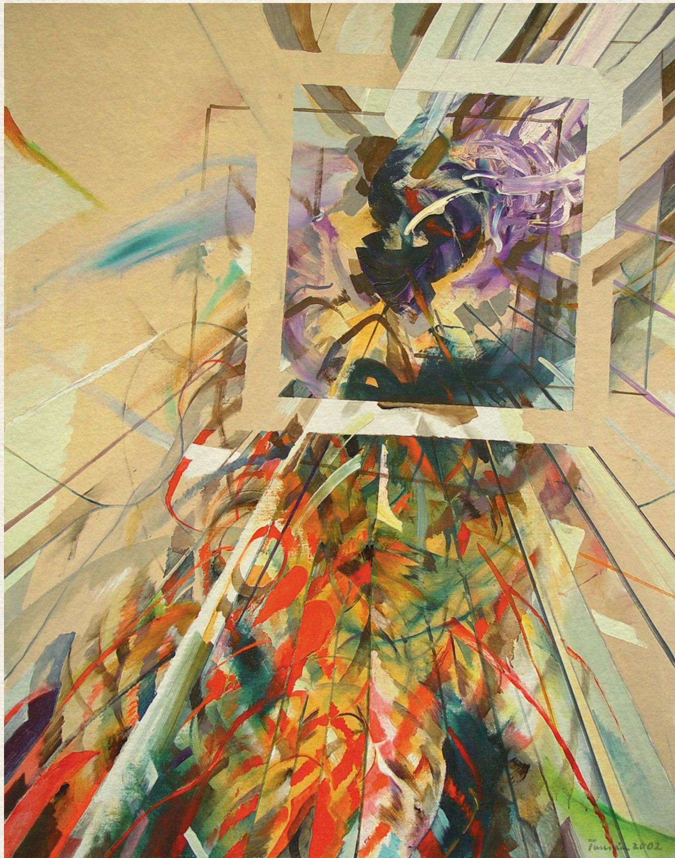
LÁTVÁNYTERV – 2002., farost, olaj, 131x100 cm