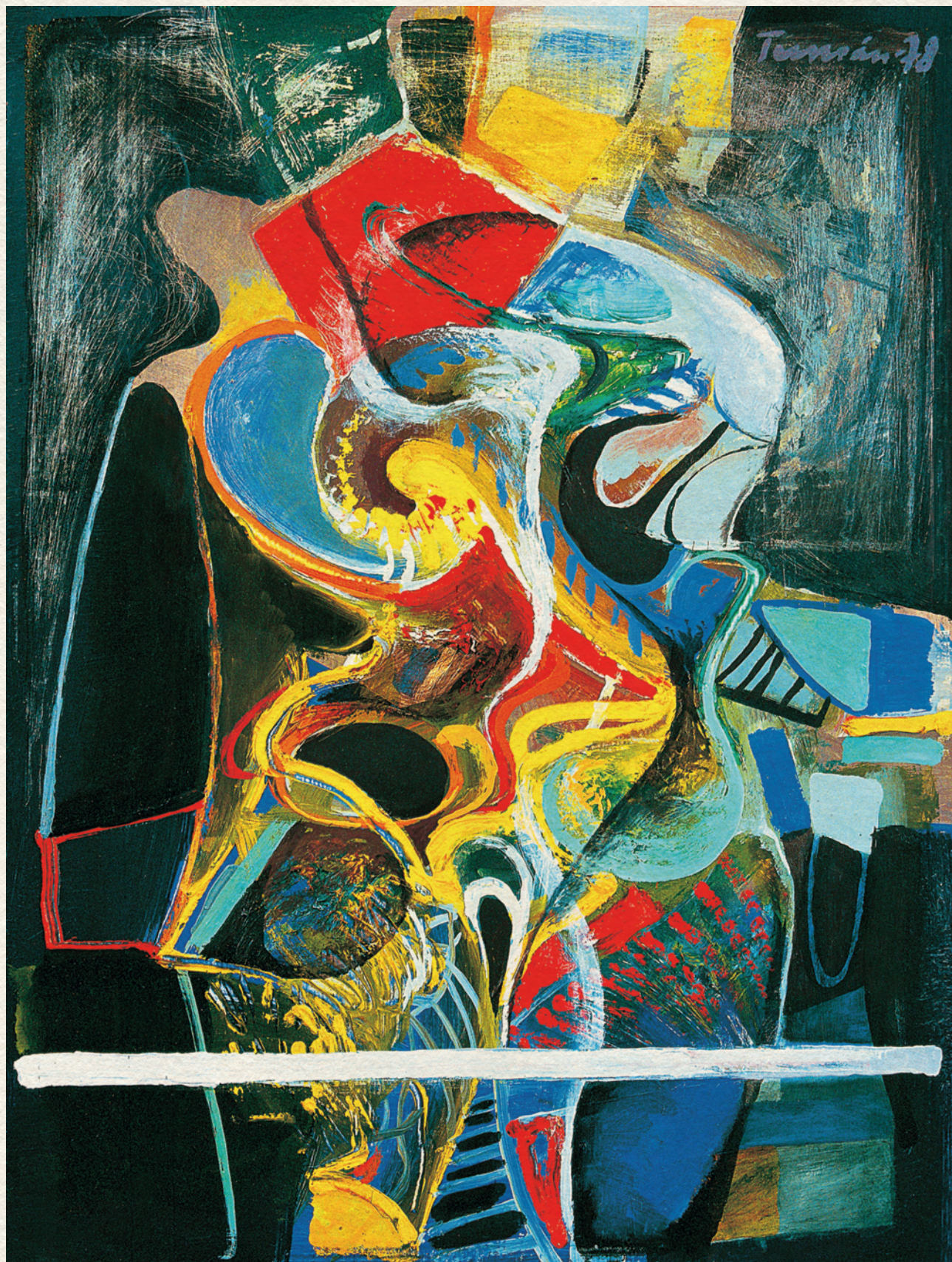
BAGOLY – 1978., farost, olaj, 40x30 cm