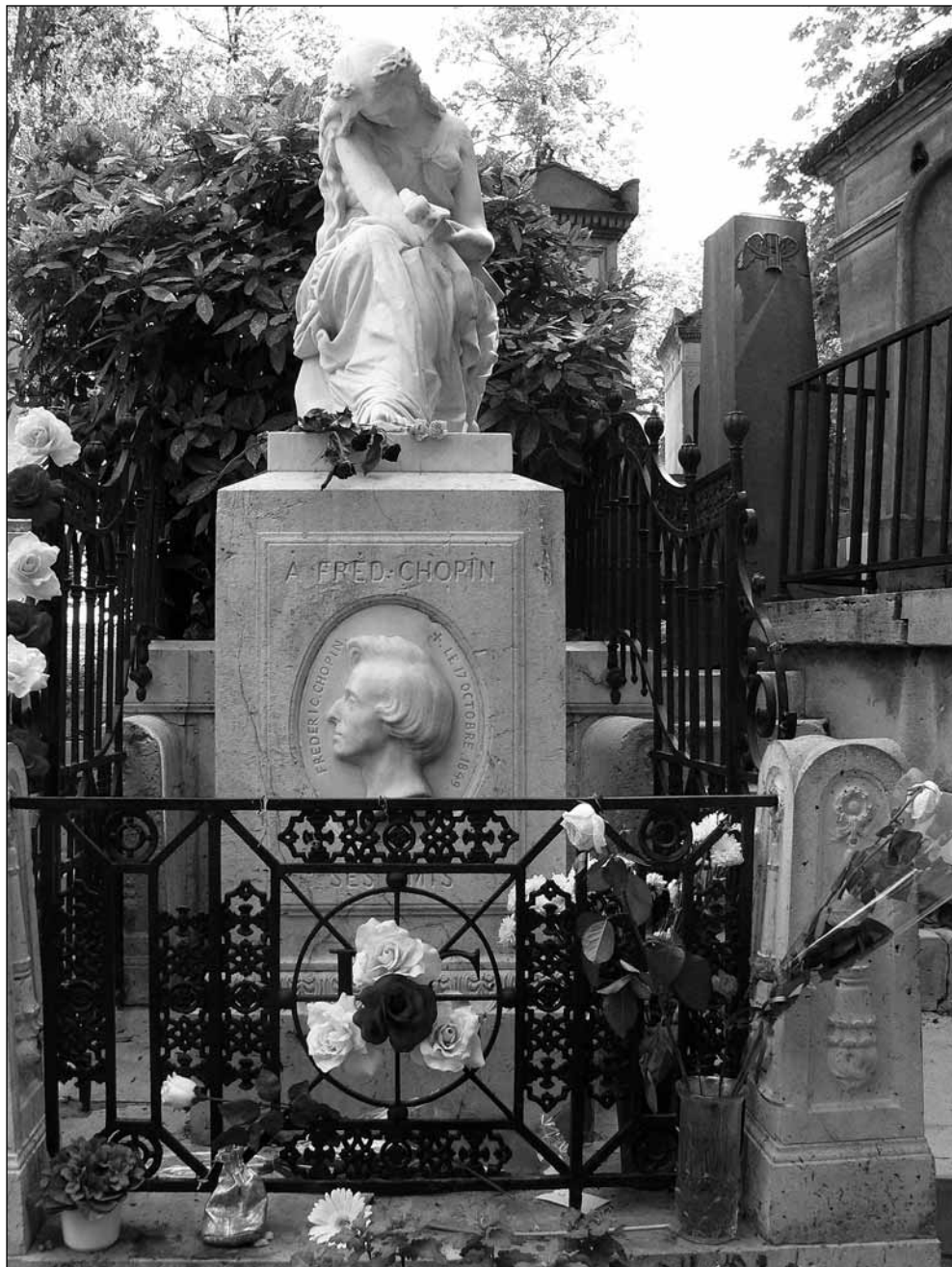
FRÉDÉRIC CHOPIN (1810–1849) SÍRJA A PÈRE LACHAISE TEMETŐBEN