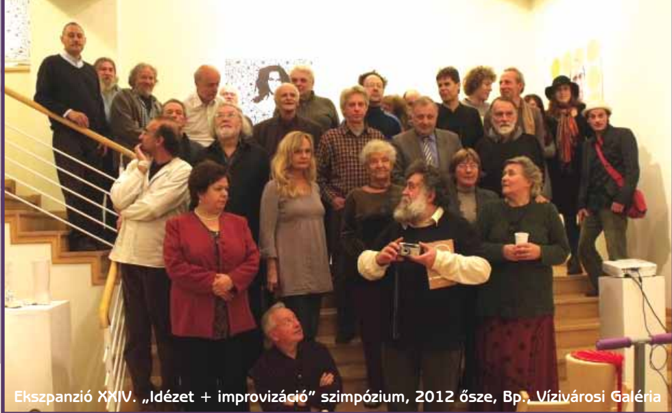
Ekszpanzió XXIV. „Idézet + improvizáció” szimpózium, 2012 ősze, Bp., Vízivárosi Galéria