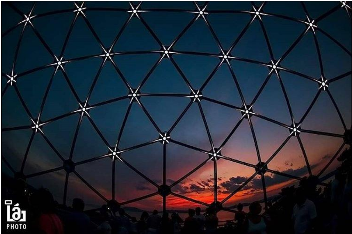
Nagylátószögű felvétel a balatonboglári Xantus János Gömbkilátóból