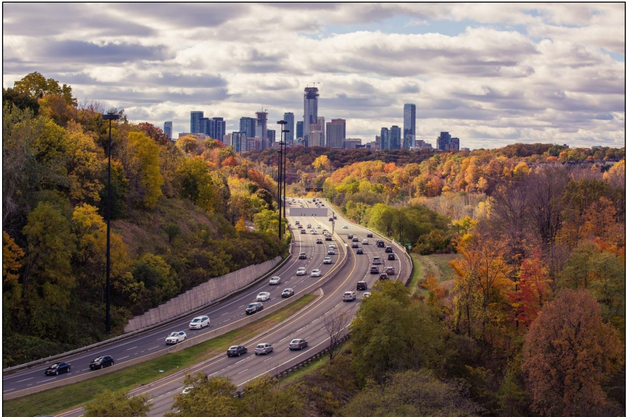
Úton a belváros felé (The Don Valley Parkway from the Leaside Bridge, Toronto)