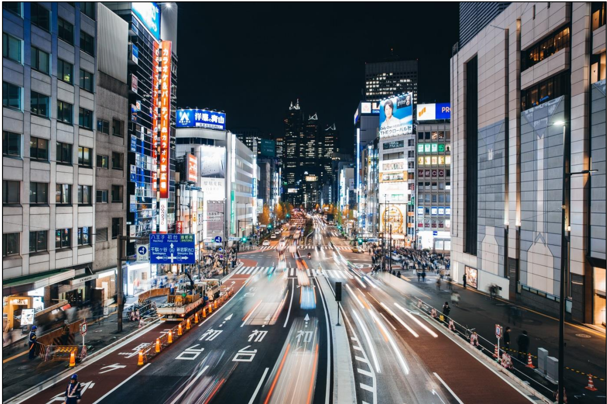
Éjszaka Tokióban (Tokyo At Night)