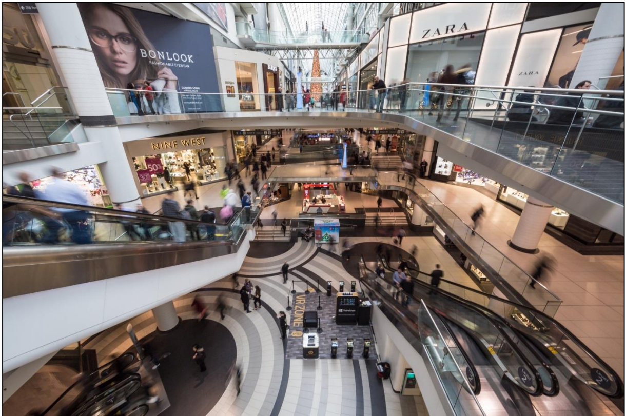
Bevásárlóközpont (View from second floor of shopping center – Eaton Centre, Toronto)